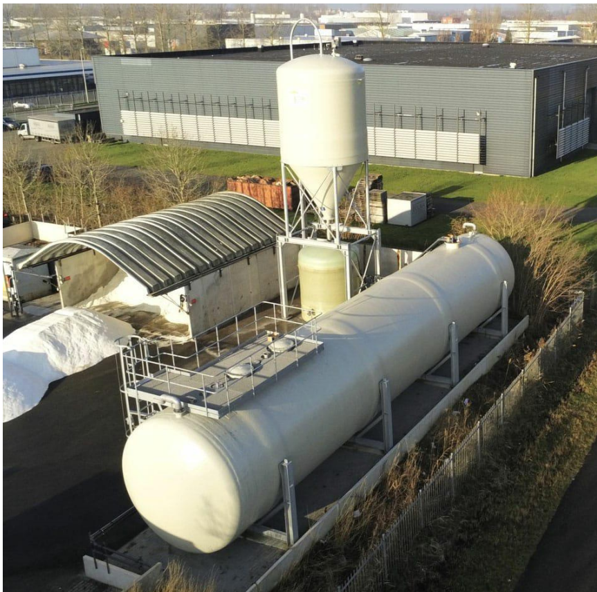
strooizout- en pekewateropslag Hidalgoweg Leeuwarden

Medio maart 2022 eindigde de consignatieperiode voor de duurzame gladheidbestrijding door Fryslân Miljeu in de gemeenten Leeuwarden, Harlingen en Waadhoeke. In de maanden daarvoor zijn circa 20 rondes met pekelsproeien en zoutstrooien uitgevoerd tijdens veelal kwakkelend winterweer.